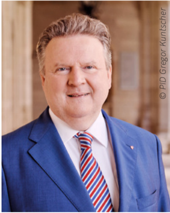
DR. MICHAEL LUDWIG, BÜRGERMEISTER UND LANDESHAUPTMANN VON WIEN

Wien gilt für viele Kunstinteressierte als Welthauptstadt der Musik. Das Fundament für die außergewöhnlichen Fertigkeiten der großartigen Musikerinnen und Musiker, die bis heute in den Konzertsälen der Bundeshauptstadt konzertieren, wurde in ihren Kinder- und Jugendjahren gelegt. Daher freue ich mich sehr, dass das Bundesfinale von prima la musica heuer, ebenso wie der Festakt zum 30-jährigen Jubiläum von MUSIK DER JUGEND, wieder in Wien stattfinden.