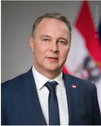
ANDREAS BABLER VIZEKANZLER / KUNST- UND KULTURMINISTER

Stolz, Lampenfieber und neue Freundschaften – prima la musica ist für die teilnehmenden Kinder und Jugendlichen weit mehr als nur ein Wettbewerb. Es ist ein emotionales und prägendes Highlight auf ihrem musikalischen Weg. Nicht nur das Können und die Leistung stehen im Mittelpunkt, sondern vor allem auch die Begegnungen, das gemeinsame Bühnenerlebnis. Hier entstehen Netzwerke fürs Leben – verbunden durch die gemeinsame Leidenschaft für Musik.